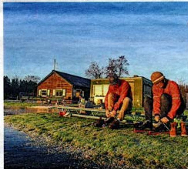
Schaatsers binden hun ijzers onder voor de eerste rondjes op natuurijs van 2024.